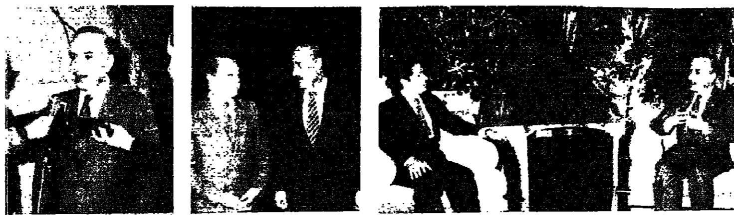
الجميل والحسيني في الاجتماع الأسبوعي (اللائي ونهرا)

كلف رئيس الجمهورية الشيخ أمين الجميل أمس المهندس عاصم قانصوه الأمين العام القطري لمنظمة حزب البعث العربي الاشتراكي نقل وجهة نظره ومقترحاته إلى المسؤولين السوريين حول مشروع الاتفاق الثلاثي الذي نشط التحرك حوله بين بيروت ومشرق.